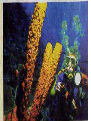
Wem Sonne, Strand aktiv gestalten: mi

ANREISE: Nach Jamaika fliegt es mit Gander Direktflügen